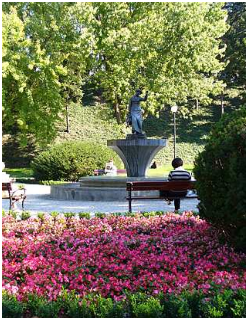
Park im. Żeromskiego

prac badawczych i inwestorskich na terenie Cytadeli pod kątem przeniesienia Muzeum Wojska Polskiego.